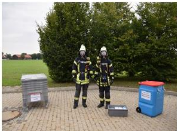
Abb. 14a Ein Bereich wird vorbereitet, an dem die Einsatzkräfte ihre PSA ablegen können.