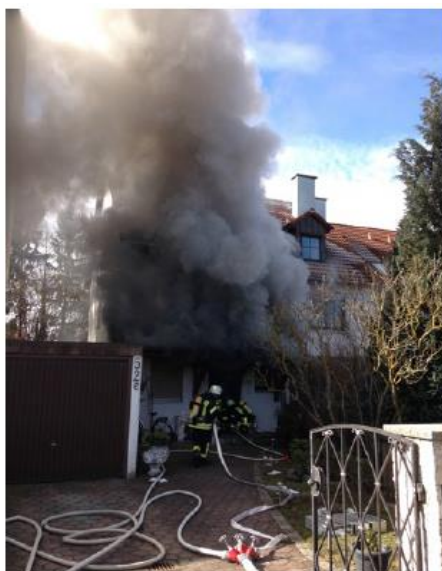
Abb. 1 Innenangriff bei einem Zimmerbrand