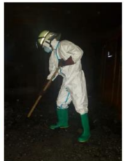
Abb. 17 Einsatzkräfte in kalten Brandstellen mit der für die jeweilige Schadensstelle geeigneten PSA