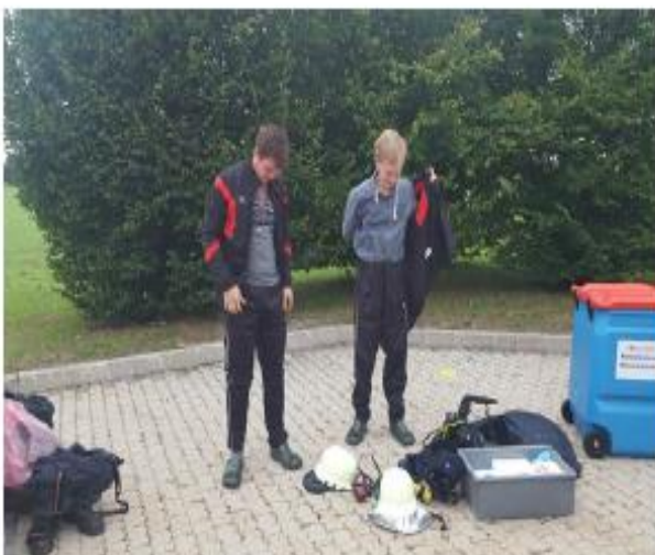
Abb. 14i Wechsel- oder Überbekleidung wird angelegt. Einmalschutzhandschuhe und partikelfiltrierende Halbmaske sind nun nicht mehr erforderlich.