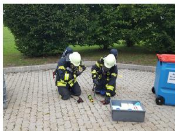
Abb. 14c Zunächst werden persönliche Ausrüstungsgegenstände und der Helm abgelegt.