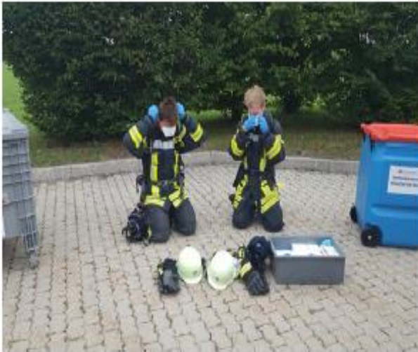
Abb. 14e Unmittelbar nach dem Abnehmen des Lungenautomaten und Ablegen des Atemanschlusses werden geeignete partikelfiltrierende Halbmasken angelegt.