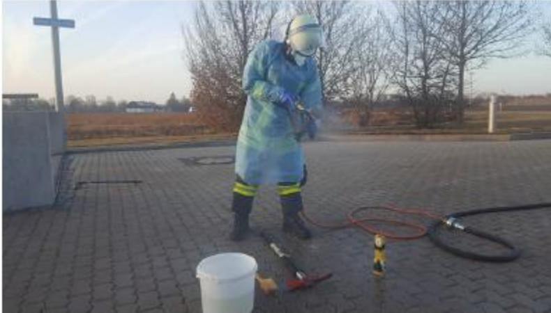
Abb. 18 Einsatzkraft beim Grobreinigen von Ausrüstung an der Einsatzstelle