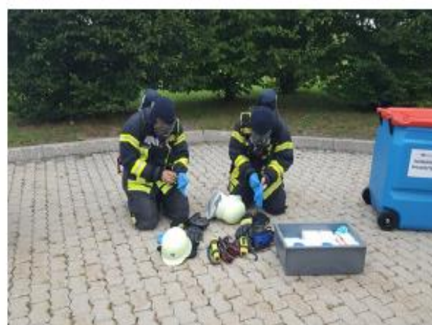
Abb. 14d Spätestens nach dem Ablegen der Feuerwehrschutzhandschuhe werden z. B. Einmalschutzhandschuhe angelegt.