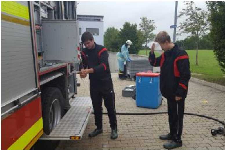
Abb. 15 Hände, Hals und Nacken werden unmittelbar nach dem Ablegen der PSA gewaschen, z. B. mit Hilfe eines Hygieneboards oder Reinigungstüchern.