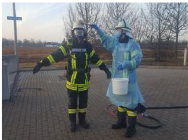
Abb. 14b Vorreinigung noch vor dem Ablegen der PSA kann sinnvoll sein, um Kontaminationen zu reduzieren bzw. Fasern und Staub zu binden.