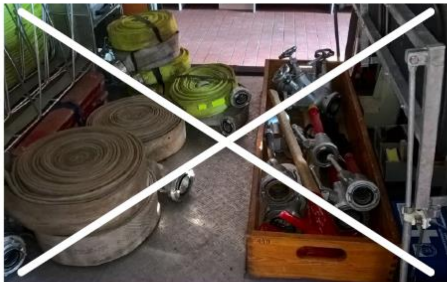
Abb. 19 So nicht! Der Mannschaftsraum wird kontaminiert, Ladungssicherung fehlt!