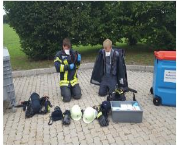
Abb. 14f Nun folgen Atemschutzgerät und Feuerwehrschutzjacke.