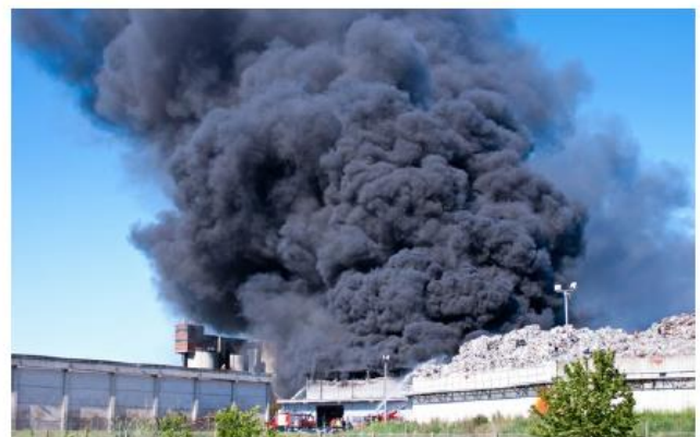
Abb. 2 Großbrand mit starker Rauchentwicklung