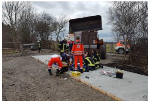
Abb. 6 a–h Einsatzszenarien mit Kontaminationsgefahr bei der Feuerwehr: Verkehrsunfälle, Brandbekämpfung, Nachlöscharbeiten, Rettungsdienstinsätze