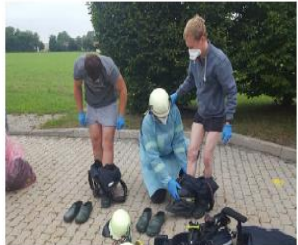
Abb. 14h Die restliche PSA wird abgelegt.