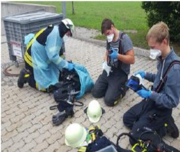
Abb. 14g Ggf. erfolgt jetzt bereits eine erste Reinigung der Ausrüstung. Dies kann aber auch durch andere Einsatzkräfte oder erst später erfolgen.